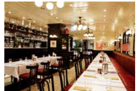
〈メインホール〉 70名様～90名様のご利用にどうぞ。