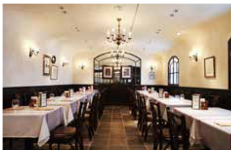
〈パーティールームA〉 広々としたお部屋です。 20名様～30名様のご利用にどうぞ。