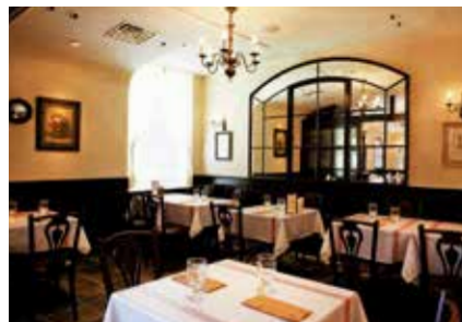
〈パーティールームB〉 こじんまりとしたお部屋です。 10名様～16名様のご利用にどうぞ。